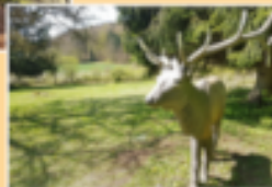
Preise Stand 1/2019 | Preisangaben vorbehaltlich. © Gabriele Reinders | Werbung, Marketing, Kommunikation